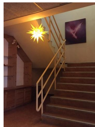
Adventster in trappenhuis Helicon