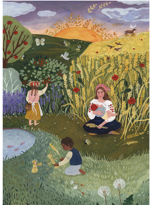
Afbeelding: 'Mallas' - Tijana Draws

(Zie https://www.vrijeschoolliederen.nl/lied/er-staat-een-molentje-langs-de-dijk/ )