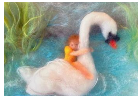
Kaart 'Jongen met Zwaan' van Het Wol Feetje